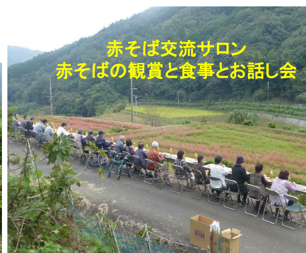
赤そば交流サロン 赤そばの観賞と食事とお話し会