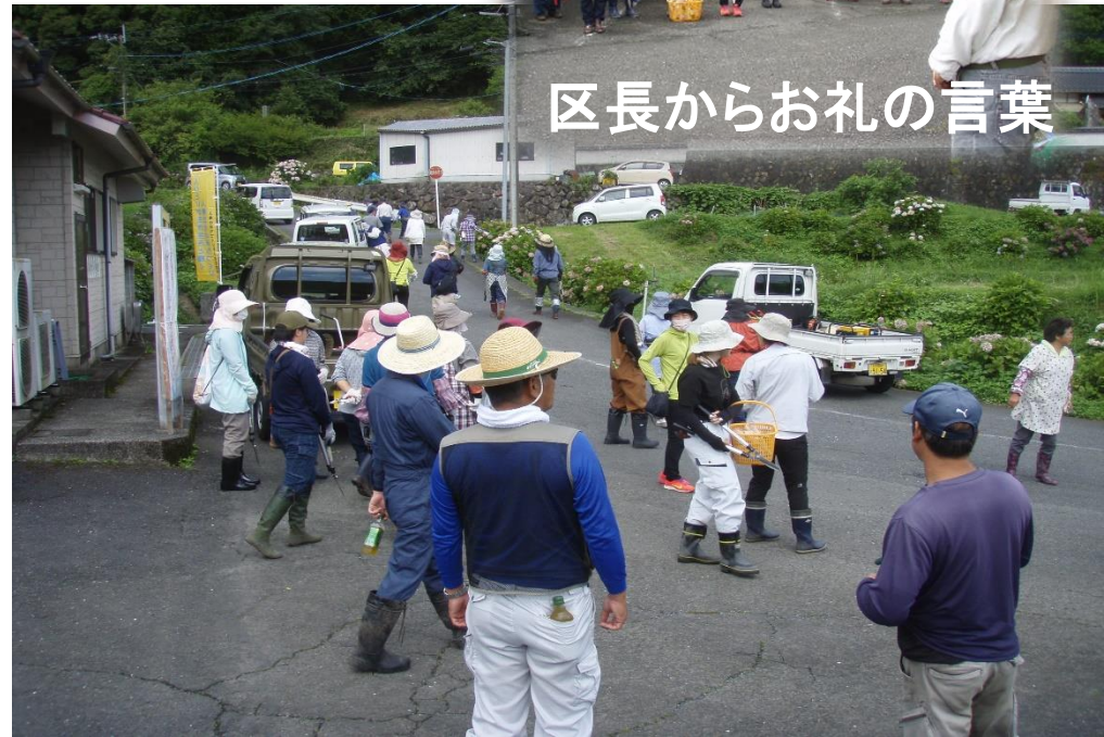
区長からお礼の言葉