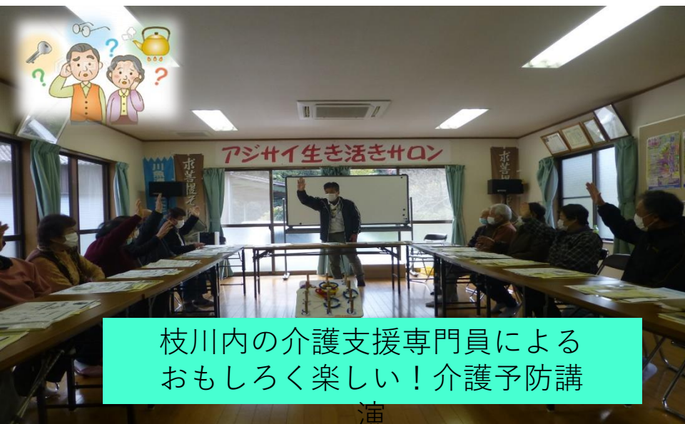
枝川内の介護支援専門員による おもしろく楽しい！介護予防講 演