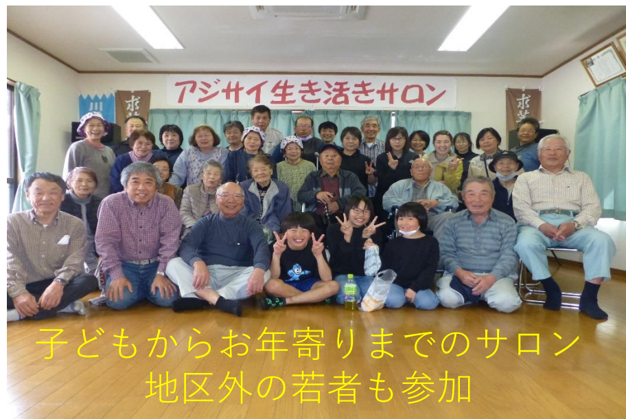
子どもからお年寄りまでのサロン 地区外の若者も参加