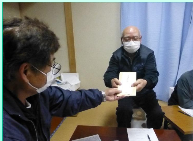
区長より手当を一人一人手渡す