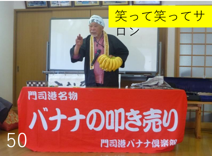
笑って笑ってサ ロン