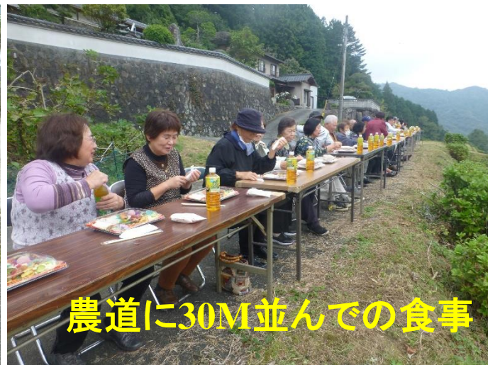
農道に30M並んでの食事