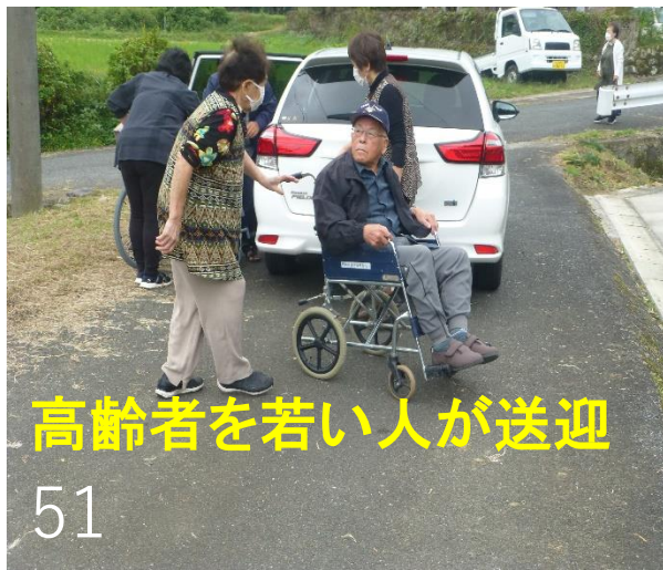
高齢者を若い人が送迎